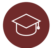
Centros de formación