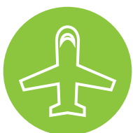
Agencias de Viaje